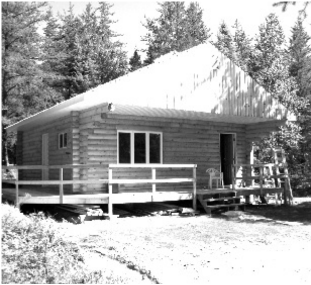
The newly built log cabin with a home away from home atmosphere