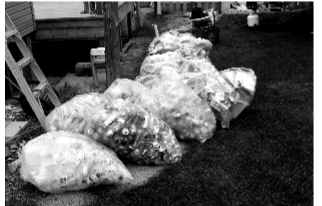
Shown above are the 16 bags of recyclable material consisting of cans, paper and plastics.